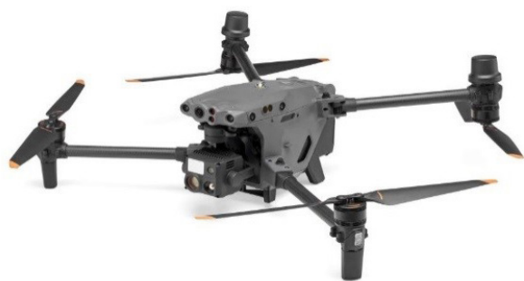
DJI Mavic 3T