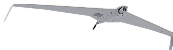
Рисунок 3. БВС самолетного типа, модель Supercam S350

дят апробацию в условиях специальной военной операции, где режимы эксплуатации и противодействия средствам радиоэлектронной борьбы существенно сложнее, нежели ожидается при решении задач в интересах органов внутренних дел.