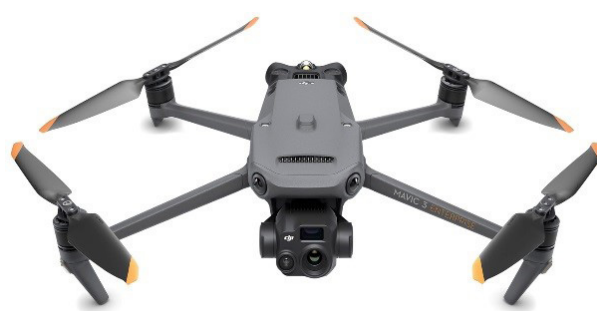
DJI Mavic 30t